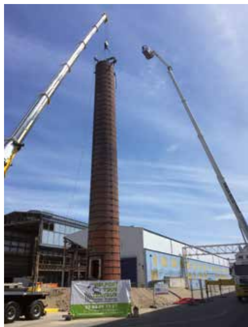
BAT 38 - ALSTOM Belfort