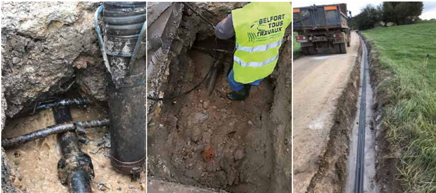
Réparation fuite d'eau 71A - ALSTOM Belfort