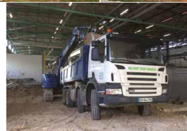
BAT 38 - ALSTOM Belfort