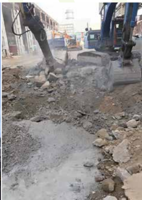
BAT 20 - ALSTOM Belfort